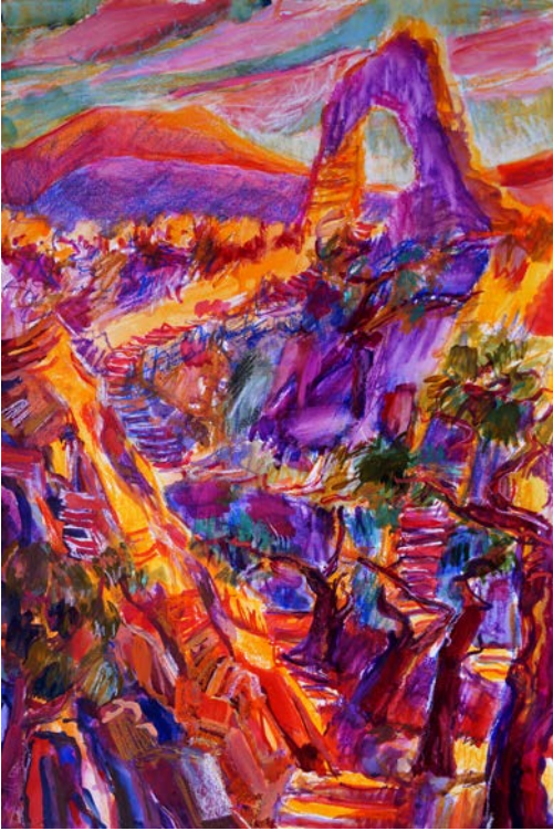
Wir schreiten fort, 2015, Mischtechnik/Papier, 60 x 40 cm

Der Mond ist blau dein Mund ist rot noch niemand konnte ihn mir verbieten was ich schaute und verließ das gebot mir der Himmel